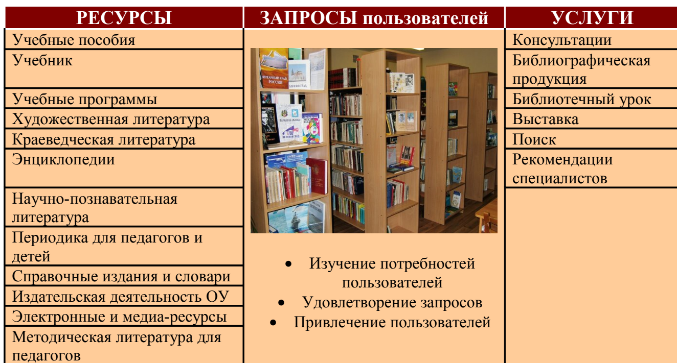
Рис 2. Схема запросов пользователей на потенциальные услуги, предоставляемые в библиотеке образовательного учреждения

Удовлетворение запроса пользователя – мера удовлетворенности пользователей предлагаемыми услугами. Интегрированный показатель количественной и качественной оценки деятельности библиотеки. Схема запросов пользователей на потенциальные услуги, предоставляемые в библиотеке образовательного учреждения (рис. 2).